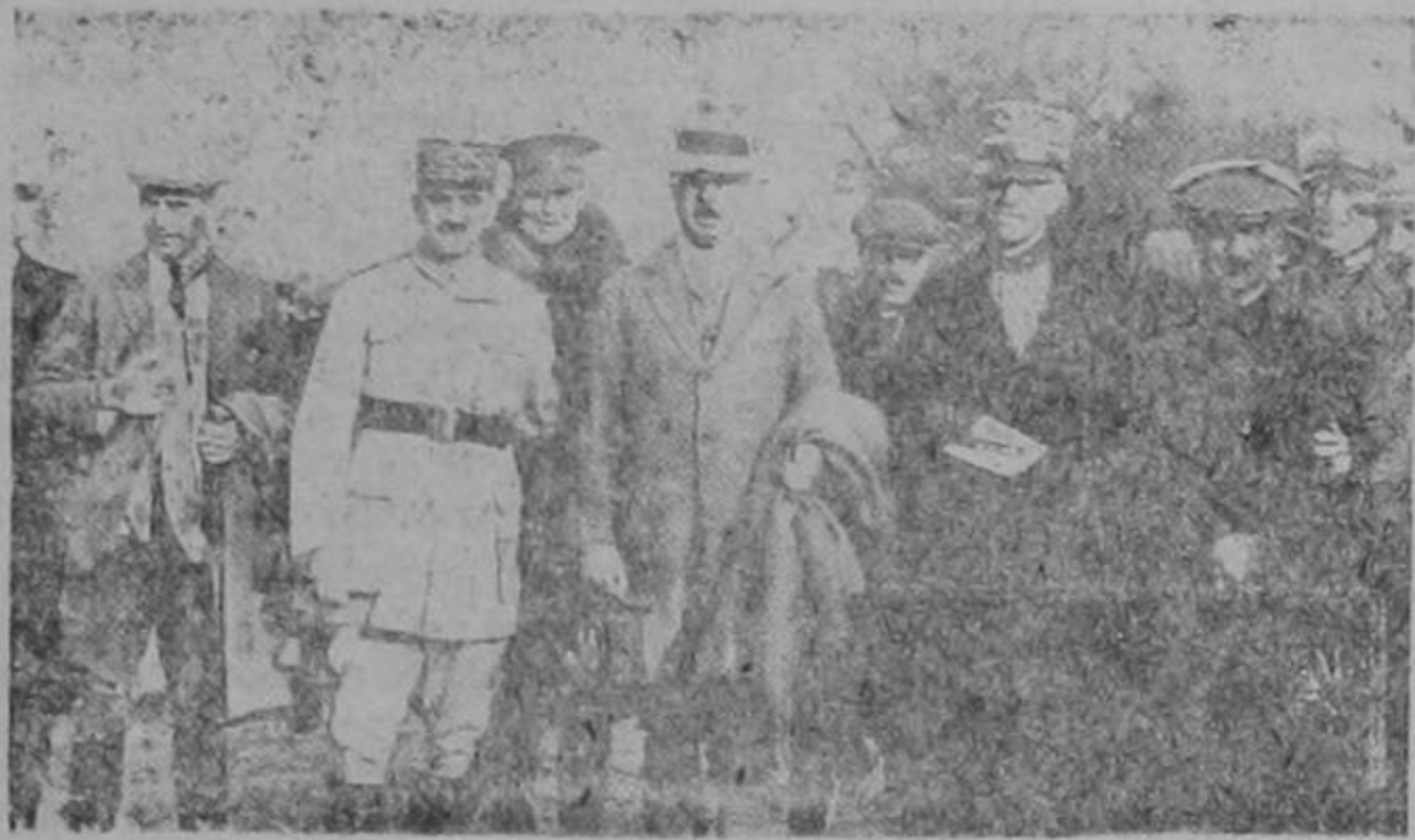
La Comisión Internacional nombrada por la Liga de las Naciones para el estudio del conflicto greco-búlgaro, acaba de terminar sus trabajos. En el centro, Sir Humboldt (Inglaterra); a la izquierda, Gral. Serrigny (Francia); a la derecha Gral. Ferrario (Italia).

Alicante.—El Ayuntamiento ha recibido un ofrecimiento de un